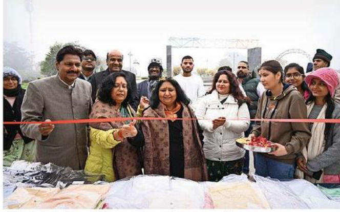
हकेंवि में दो दिवसीय प्रदर्शनी का शुभारंभ करते गणमान्य